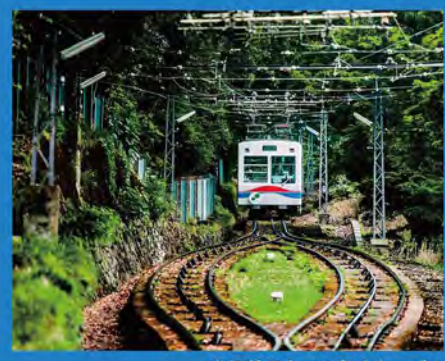
高低差日本一の叡山ケーブル