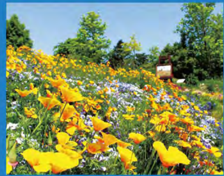
ガーデンミュージアム比叡のお花畑