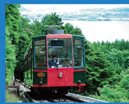
長さ日本一の坂本ケーブル