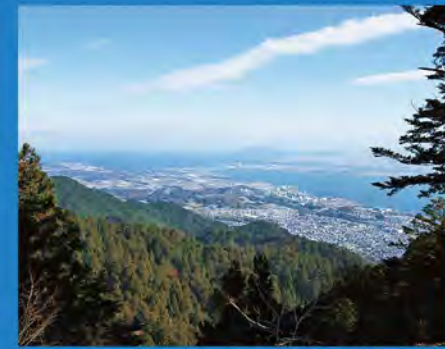
ケーブル延暦寺駅眺望